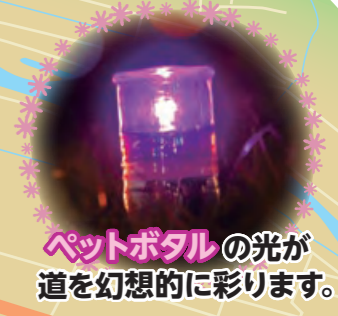
ペットポタルの光が道を幻想的に彩ります。