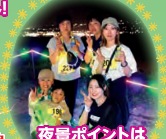
夜景ポイントはインスタ映えスポット!