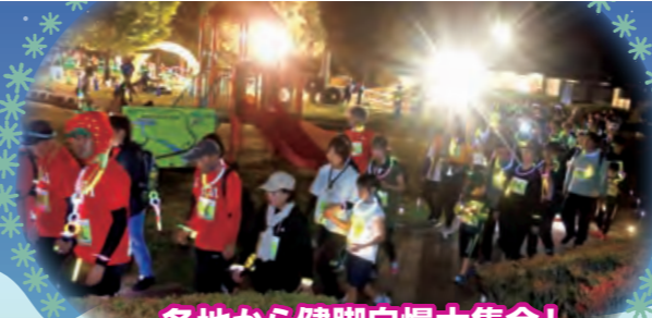
各地から健脚自慢大集合!