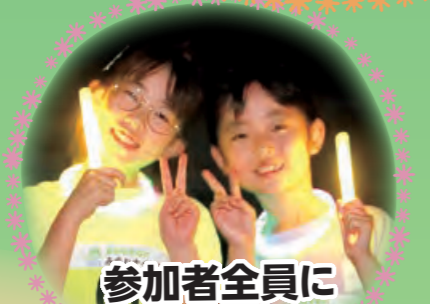
参加者全員にサイリウムライトプレゼント