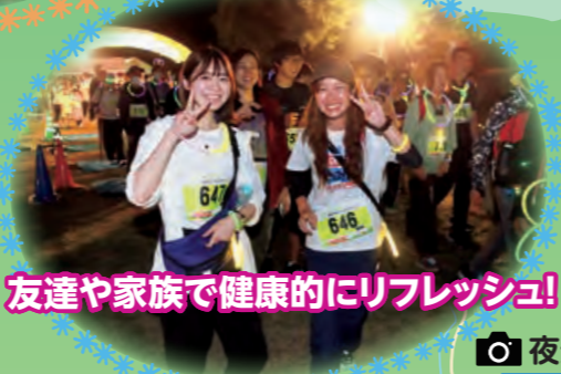
友達や家族で健康的にリフレッシュ!