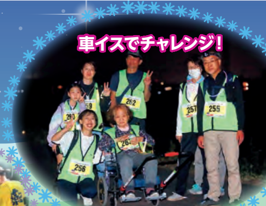
車イスでチャレンジ!