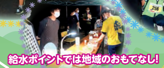
給水ポイントでは地域のおもてなし!