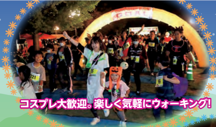
コスプレ大歓迎。楽しく気軽にウォーキング!