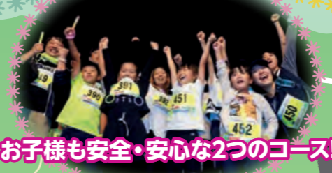
お子様も安全・安心な2つのコース!