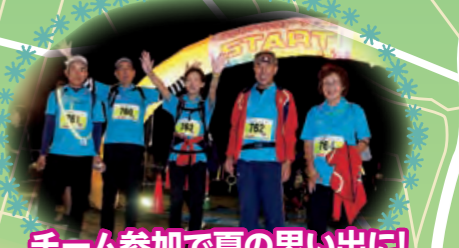
チーム参加で夏の思い出に!