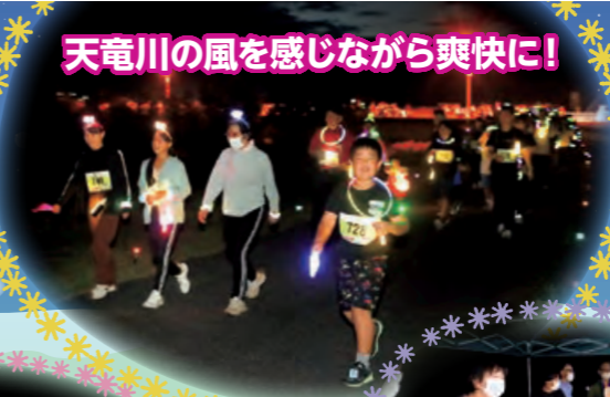
天竜川の風を感じながら爽快に!